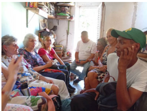
Treffen von Netzwerkmitgliedern: EcoMujer DId. und Ando Reforestando

Sachspende EcoMujer e.V. an Ando Reforestando